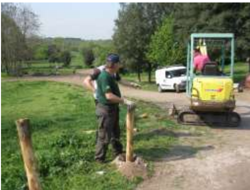
La realizzazione della staccionata