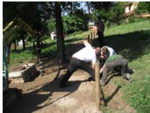
La realizzazione dello stradello per disabili e anziani