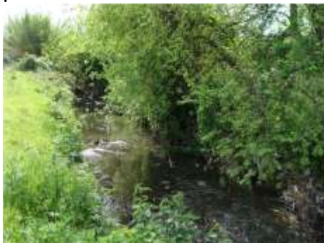
L'Almone sta rinascendo