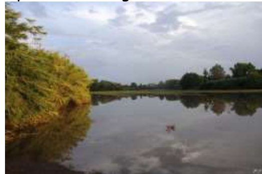
La Caffarella allagata